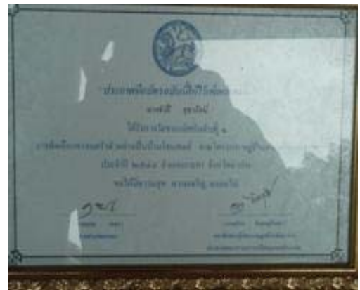
กรมป่าไม้ กระทรวงเกษตรและสหกรณ์ พัฒนาอาชีพป่าไม้ ตัวอย่าง ระบบสหกรณ์ ประจำปี 2542 2548