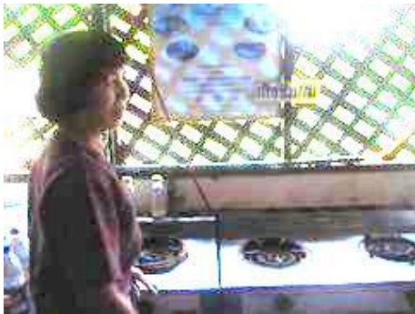
การประกอบอาหาร โดยใช้ก๊าซชีวภาพจากมูลสุกร

เลี้ยงสุกร โดยมูลสุกร ลงบ่อพักฯแล้วนำมาผลิตเป็นก๊าซชีวภาพใช้ในการประกอบอาหาร