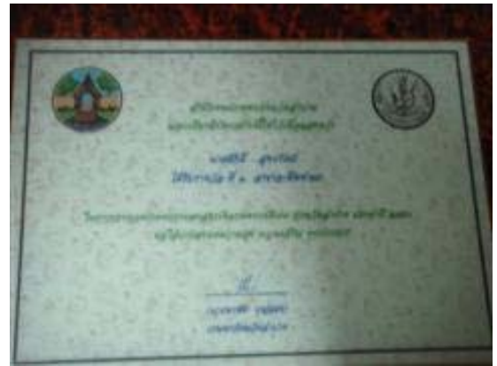
รางวัลที่ 1 ประกวดเกษตรกรสถาบันเกษตรกรดีเด่นสาขาทำนา ประจำปี 2550 โดยนายอมรทัต นิรัติศยกุล ผู้ว่าราชการจังหวัดลำปาง ลำปาง