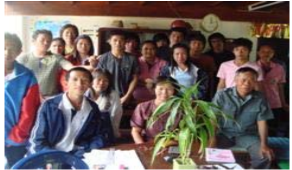
นักศึกษา กศน. มาศึกษาดูงานเรื่องเศรษฐกิจพอเพียง